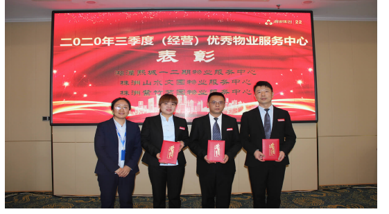
集团财务总监为三季度(经营)优秀物业服务中心颁奖 湘潭熙城二期物业服务中心 株洲山水文园物业服务中心 株洲紫竹茗园物业服务中心