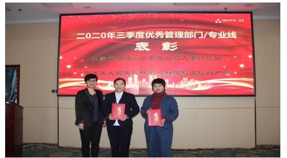
集团总裁助理为三季度优秀管理部门/专业线颁奖 张家界湘银置业有限公司人事行政部 天元区人民医院妇产科

最后,董事长用“感谢、感动、敢担当”三个词对本次大会进行总结。他对获得优秀表彰的团队进行了肯定,对集团内形成的比学赶超、力争上游的工作氛围倍感欣慰,也希望存在不足和落后的团队,能够通过此次公平公正的评比,总结和反思工作的亮点和不足,敢于担当,提出纠偏措施,明确改进方向,加快提