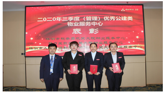
集团总裁办主任为三季度(管理)优秀公建类物业服务中心颁奖 株洲市税务局机关大院物业服务中心 溁口区政府机关大院物业服务中心 株洲市人社局机关大院物业服务中心