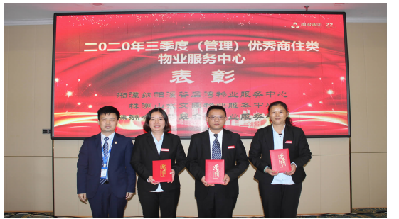
集团总裁办主任为三季度(管理)优秀商住类物业服务中心颁奖 湘潭纳帕溪谷后湾物业服务中心 株洲山水文园物业服务中心 株洲金轮翡翠名园物业服务中心